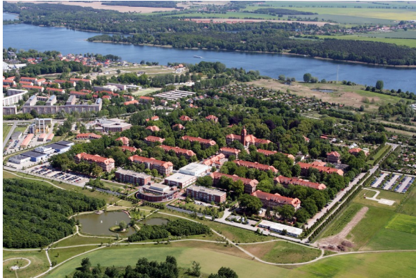
Luftbildaufnahme der Universitätsklinik Ruppin-Brandenburg